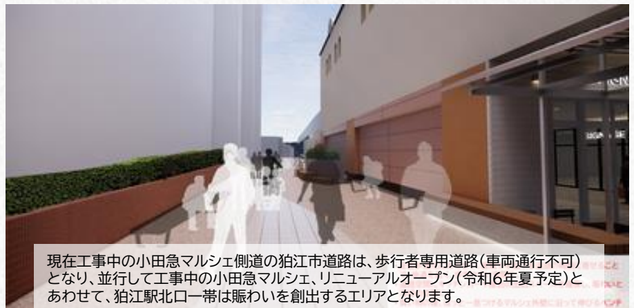
現在工事中の小田急マルシェ側道の狛江市道路は、歩行者専用道路(車両通行不可)となり、並行して工事中の小田急マルシェ、リニューアルオープン(令和6年夏予定)とあわせて、狛江駅北口一帯は賑わいを創出するエリアとなります。