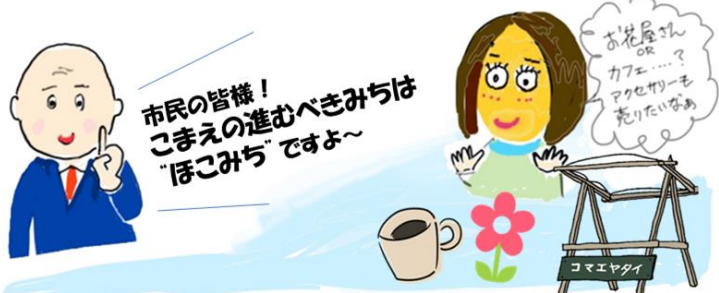
4コマ漫画作 三宅まこと

で、新年度からほこみち本格運用が始まります。現在行われている道路工事完了後に、市民の自由な発想で道路を活用できます。