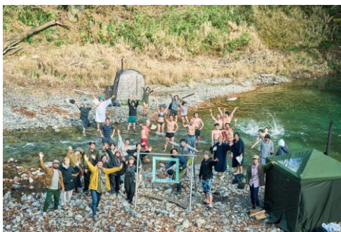
多摩川を流域で考えるTAMARIBA TALK ～源流部・檜原村で始まった BACK TO RIVERプロジェクト～

今回のTAMARIBAでは、MORE TAMAGAWA企画として、より多摩川を楽しめる企画が用意されています。