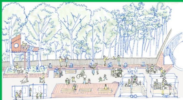
ほこみち(歩行者利便増進道路)を 狛江市に提案した際に使用した 狛江駅北口のイメージパス