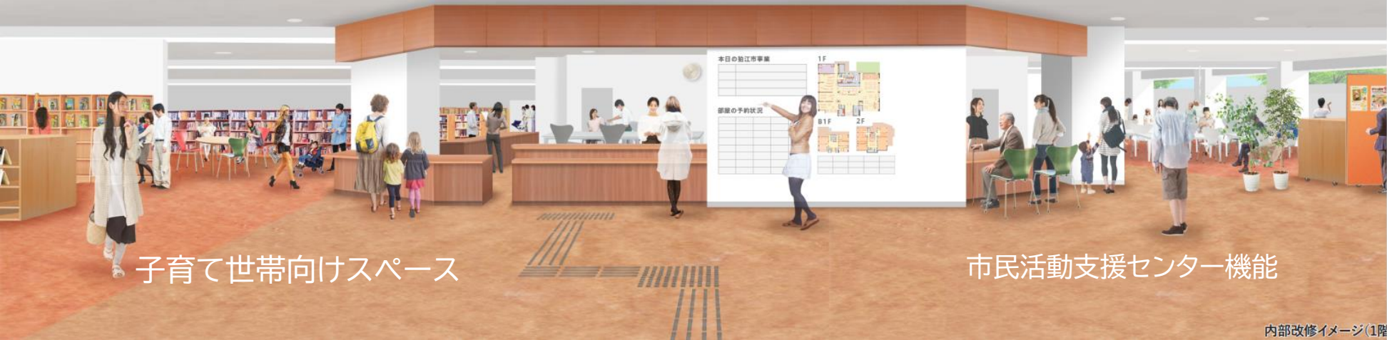
子育て世帯向けスペース